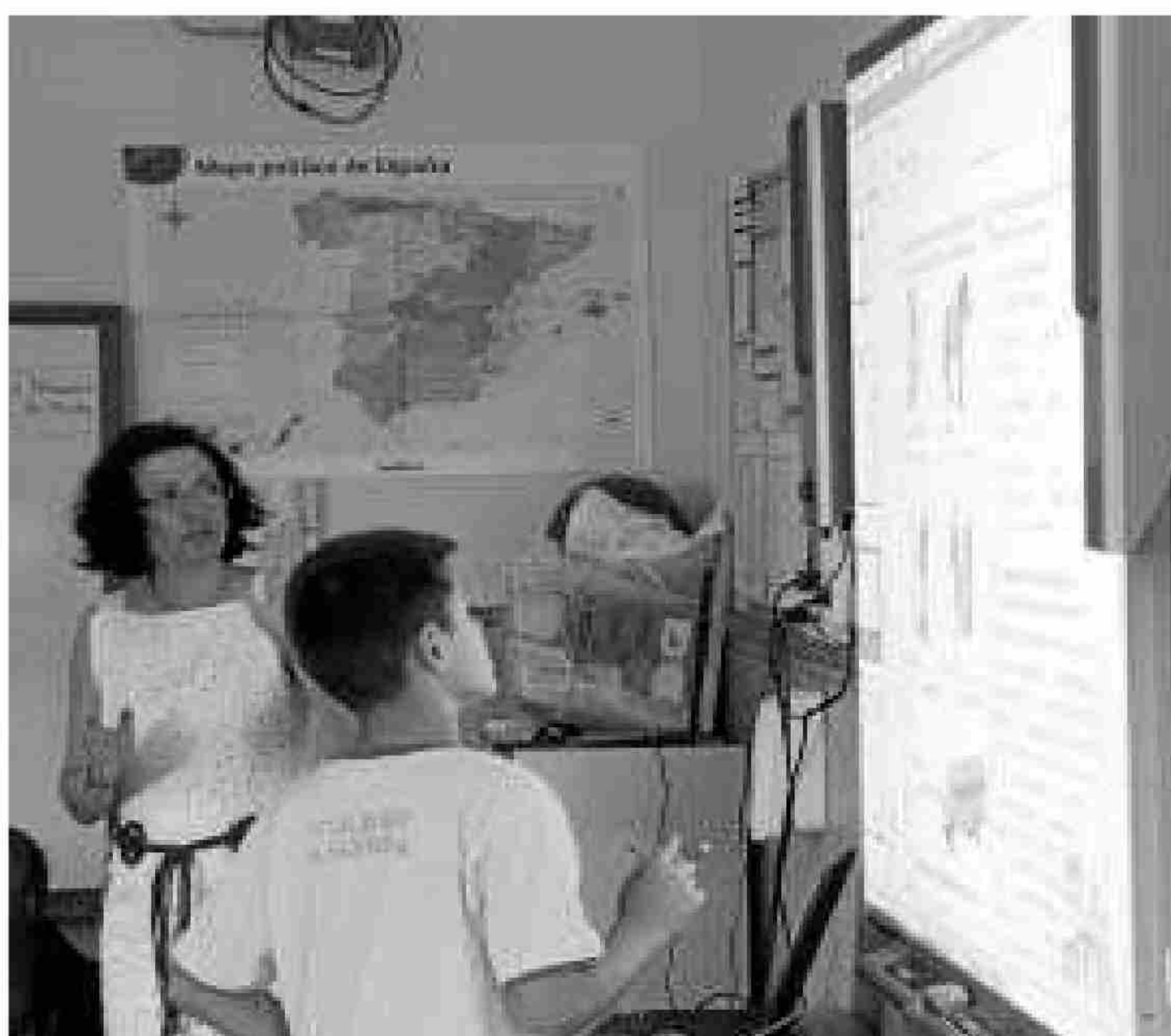
La pizarra digital es imprescindible para impartir los contenidos.

plataforma y el cambio de metodología. Ellos también pueden acceder a la plataforma digital, a sus contenidos y comprobar los deberes que para ese día tienen asignados los alumnos. Aún así, para los más reacios al cambio, se facilitan el material en PDF y pueden disponer de él en papel a través de un servicio de reprografía que estará disponible en breve en el centro.