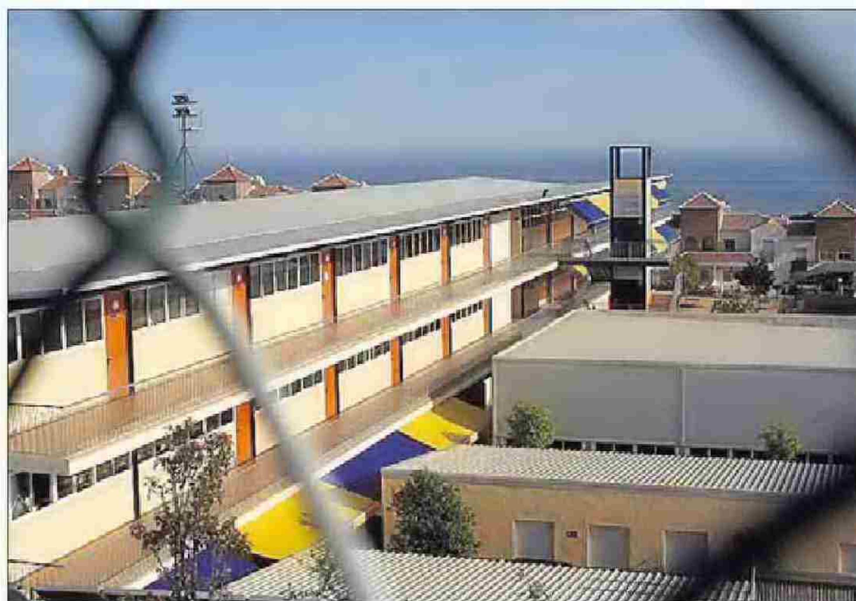
Textos. El colegio privado Añoreta, en Rincón de la Victoria. ARCINIEGA

El proyecto cuenta con el apoyo del grupo de investigación