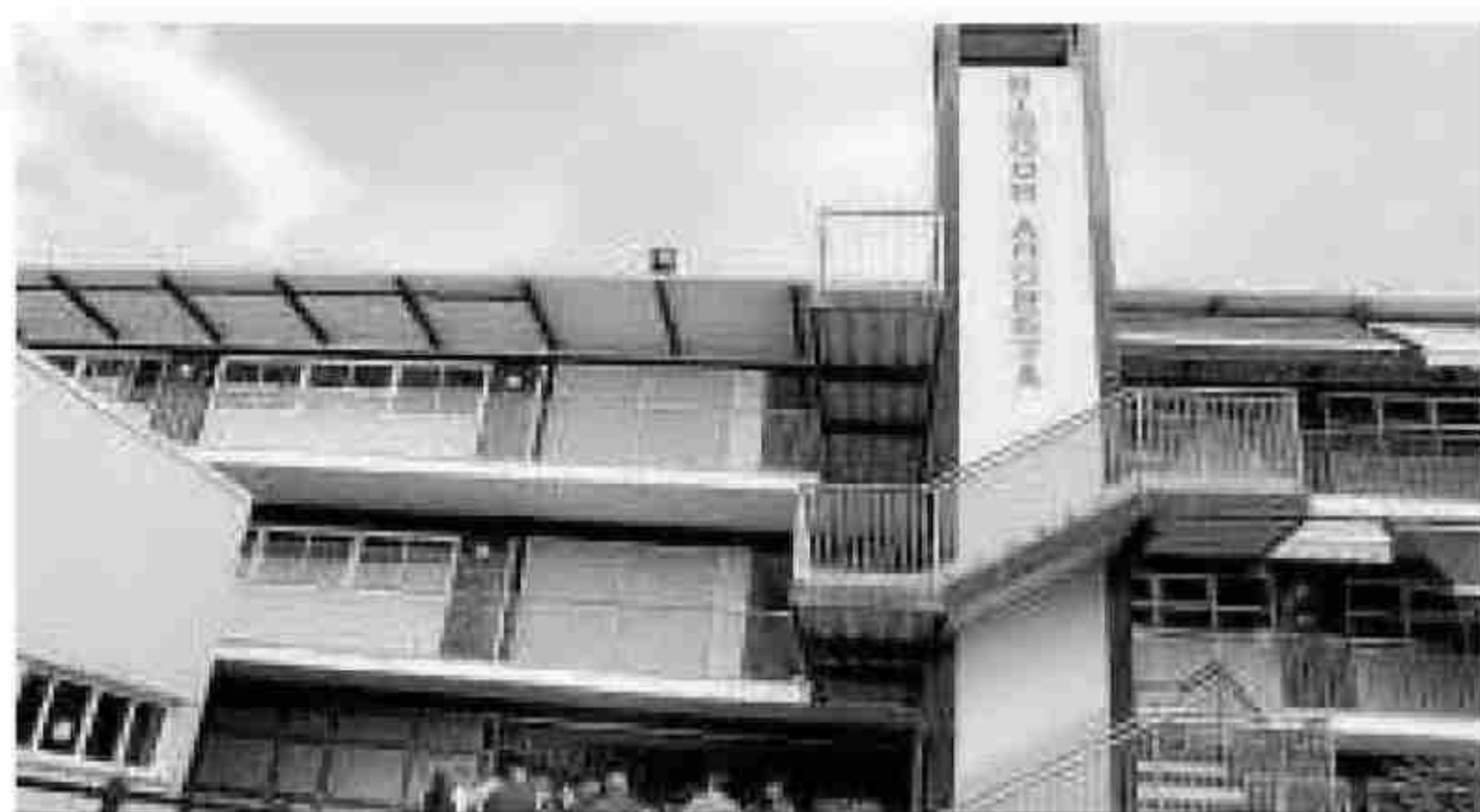
Exteriores del colegio Añoreta, en Rincón de la Victoria.