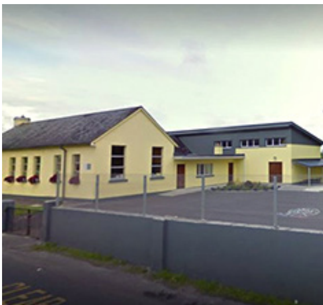
Newtown National School