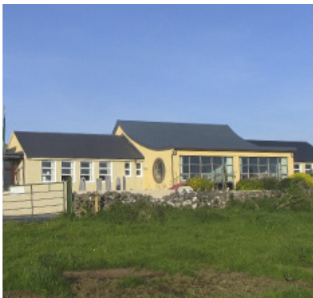
Gardenfield National School