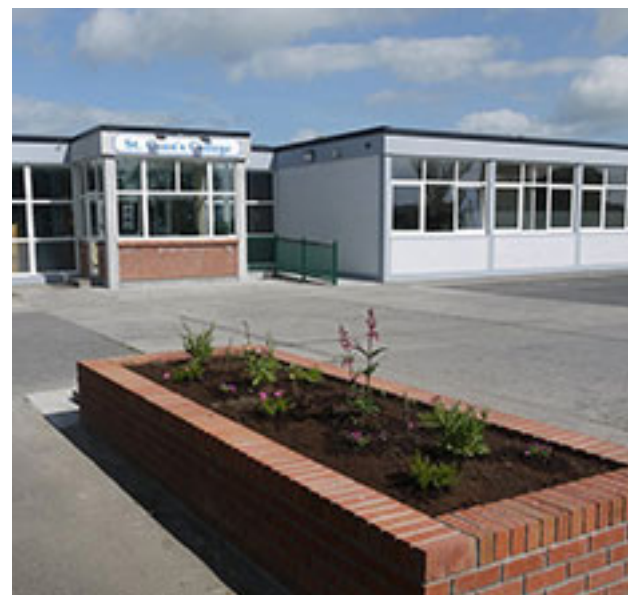
St. Cuans Secondary School