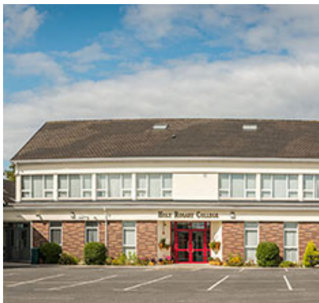
Holy Rosary College