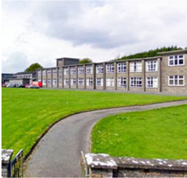
Presentation College Tuam