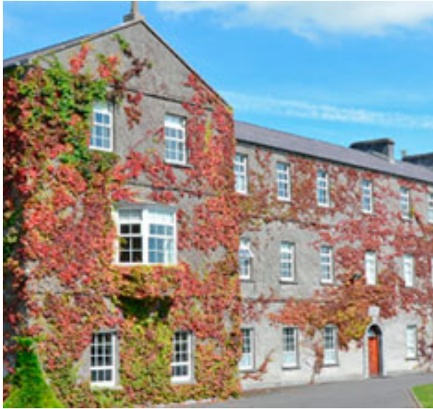
St. Jarlaths College Tuam