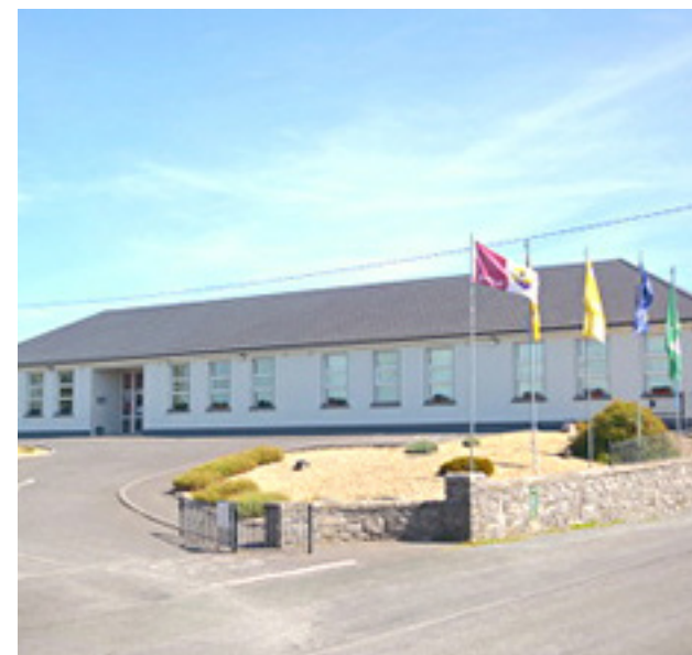
Claran National School