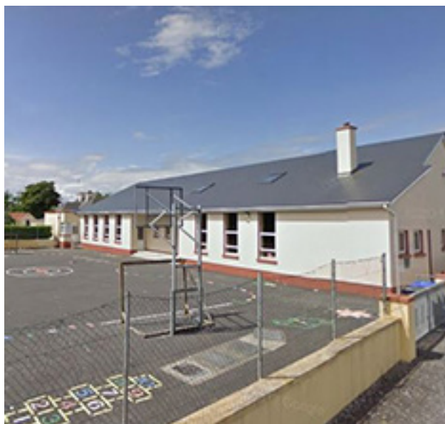
Brierfield National School