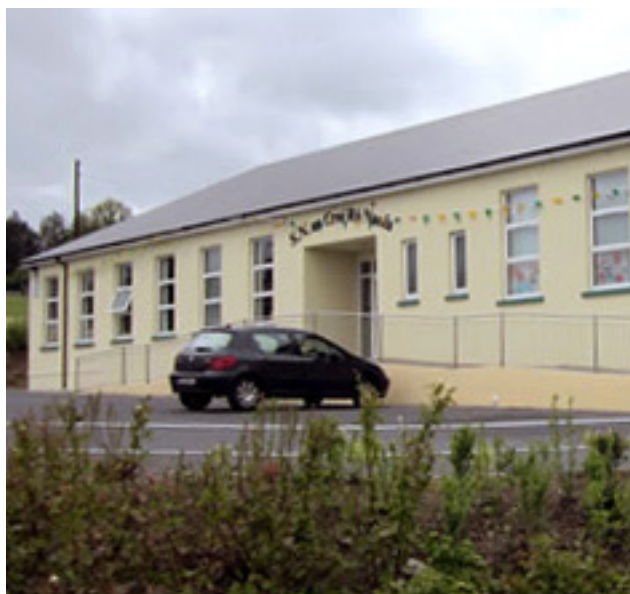
Belclare National School