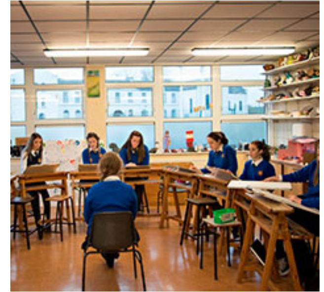
Mercy Secondary School Tuam