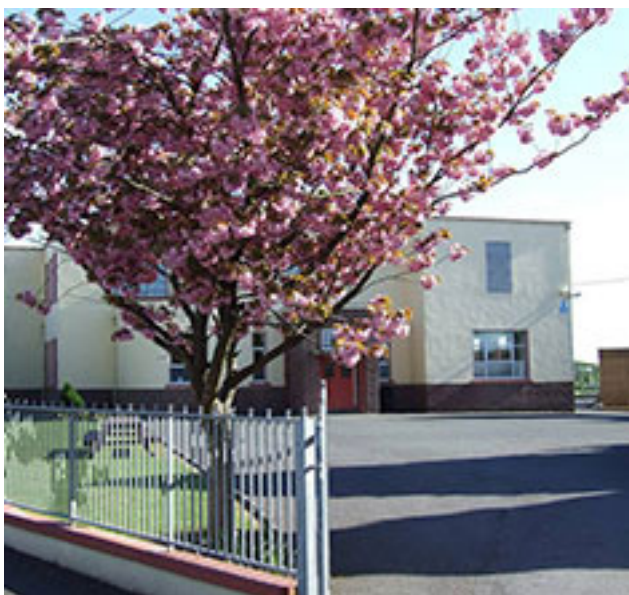
Archbishop Mchale College Tuam